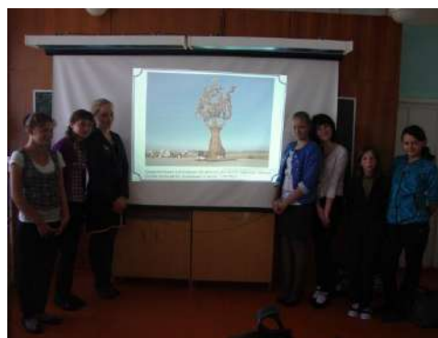
Учащиеся 8 класса на фоне презентации.