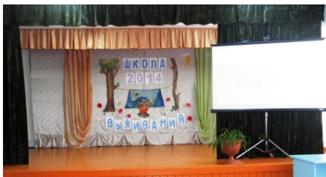
Сцена с. Александровка