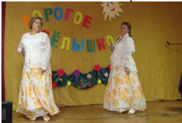
Гости из деревни Леонова