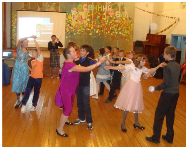
Какой бал без танцев...

Для старшеклассников бал состоялся днём позже. Вечером 25 сентября школа наполнилась весёлыми улыбками ребят, ожидающих праздника. В программе вечера была интересная сценка с актёрами из 9 и 11 класса.