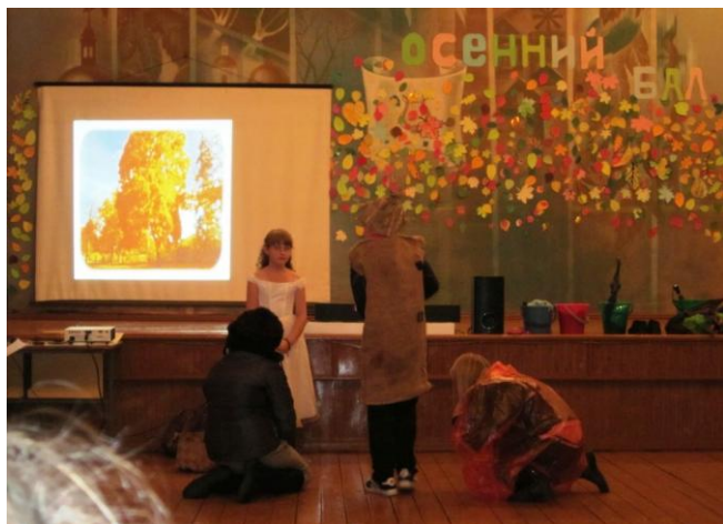
Королева с придворными.

24 сентября в нашей школе состоялся «Осенний бал» для учащихся. Все дети очень ждали этого праздника и, конечно, тщательно подготовились к нему. Интересные костюмы, весёлые конкурсы, стихи об осени, и отличное настроение были главными атрибутами этого вечера. Ещё нужно отметить детей, которые участвовали в сценке. Им отдельное «спасибо». Все дети и учителя остались довольны проведённым временем.