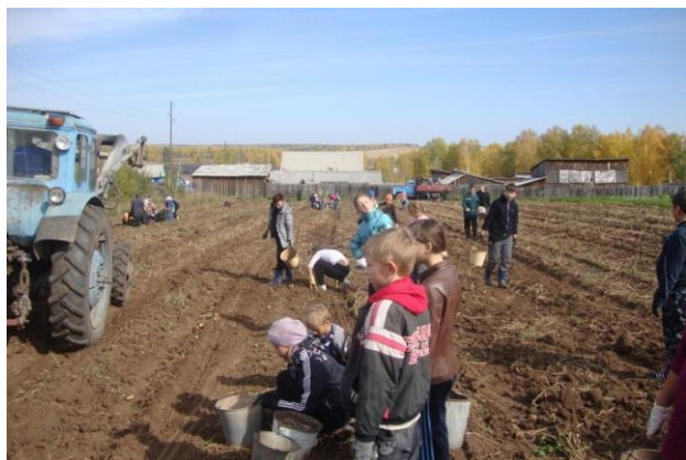
На поле «боя»