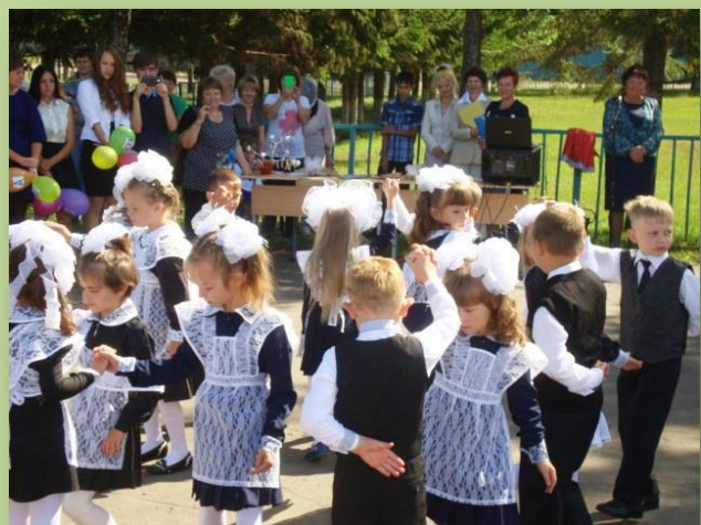
Первый школьный вальс