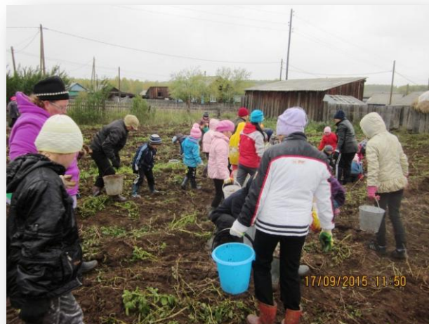
«Один в поле не воин»

Заканчивали убирать картофель 21 сентября. Погода была отличная. Справились с работой очень быстро, убрали в закрома 391 ведро картофеля. Ура!!!