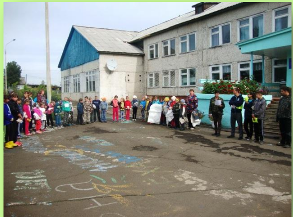
Линейка перед субботником