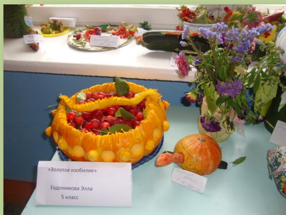
«Золотое изобилие» Евдокимова Элла 5 класс