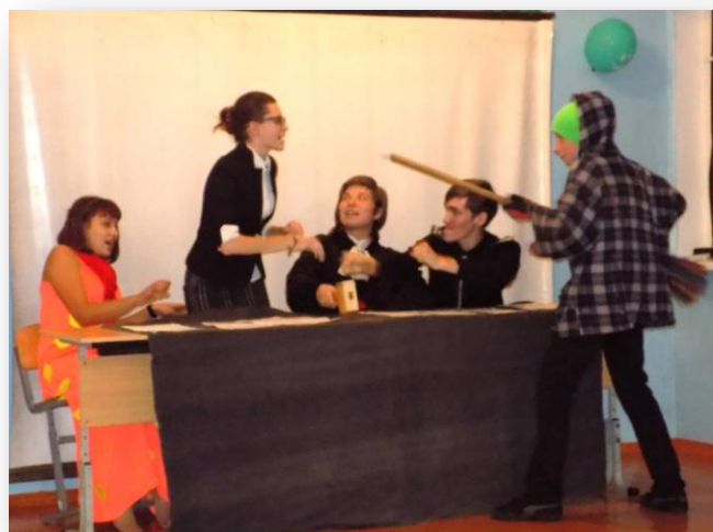
Суд над Осенью

Далее состоялся «Суд над осенью», в котором обвиняемая была полностью оправдана.