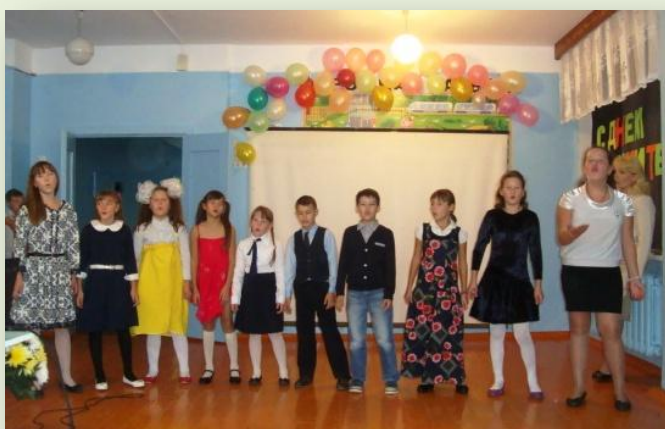
Детский вокальный ансамбль «Искорки» поздравляет учителей.