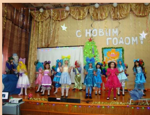
Куклы и Ко