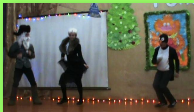
Сцены из спектакля