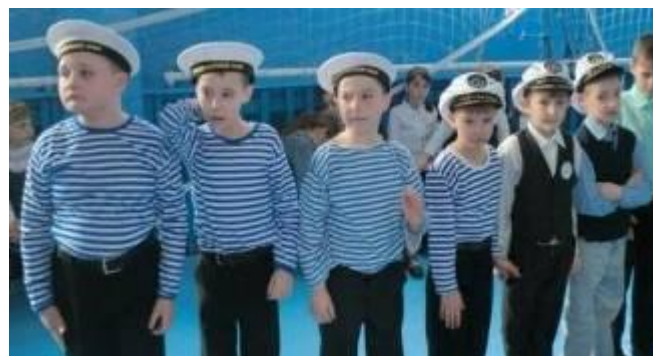
Победители – матросы 1 класс

Очень важна была поддержка классных руководителей и болельщиков, в основном девочек. Здесь энтузиазма им было не занимать, постарались для своих защитников. Мероприятие прошло бодро и весело. У всех было приподнятое настроение. А результаты оказались такими: 1 место -1 кл; 2 место -3 кл; 3 место-4 кл, 4 место-2 класс. Молодцы!