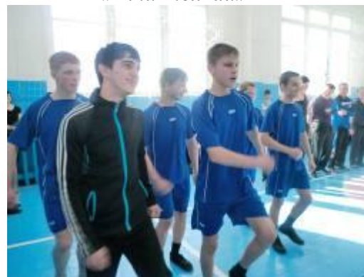
С песней по жизни...