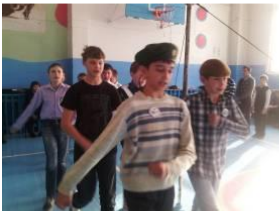
Команда шестого класса

Продолжили эстафету мероприятий, посвящённых Дню Защитника Отечества, парни 5-7 классов. Ребята пятого класса ещё совсем детски переживали, что они совершенно ни в чём не смогут соперничать с уже значительно подросшими семиклассниками. Но у них были и свои преимущества, единая форма – морских пехотинцев, хорошая строевая подготовка. Зато ребята шестого класса очень здорово исполнили строевую песню и показали спортивные результаты. Так как разница в весовых категориях пятого и седьмого класса была «на лицо», то организаторы решили разделить соревнования на две части, а именно смотр песни и строя и спортивные соревнования. В смотре 1 место заняли самые младшие-пятиклассники. А вот между очень активными и спортивными ребятами шестого и седьмого классов развернулась настоящая борьба. Не уступая друг другу ни в скорости, ни в силе, они шли к победе. Конкурсы были сложные, на силу и выносливость. Парни подтягивались на перекладине, отжимались, прыгали в длину, бегали в противогазах, носили «раненых бойцов», перетягивали канат. Всё завершилось эстафетой. Победили ребята седьмого класса. Второе место у шестиклассников. Почётное третье место у пятиклассников.