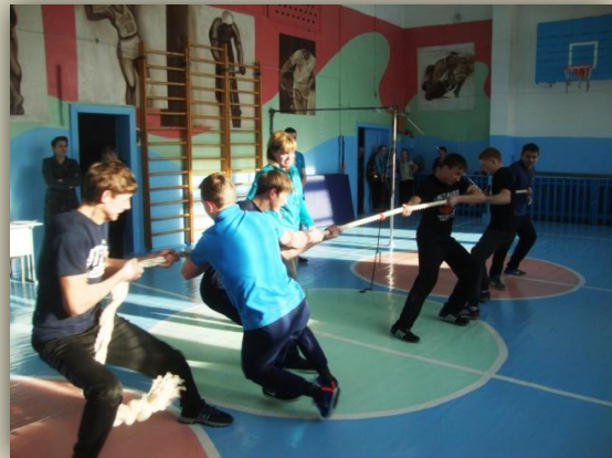
Любимый конкурс - перетягивание каната