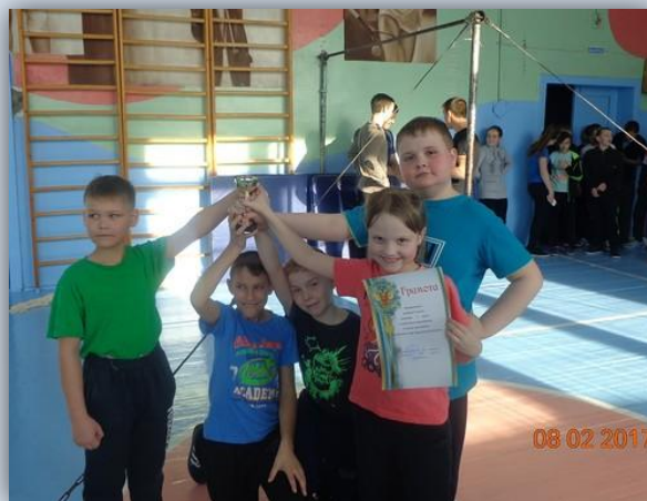
Команда 3-го класса

Разные испытания предстояло пройти нашим мальчишкам. Они очень старались, но в любой игре есть победитель. В младшем звене им стала команда третьего класса, а в среднем – шестого.