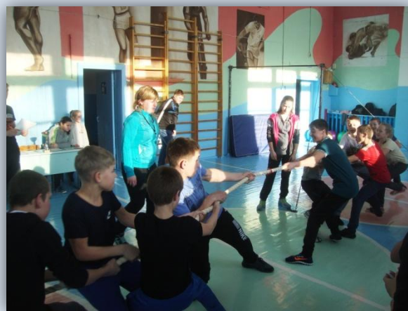
Перетягивание каната в среднем звене